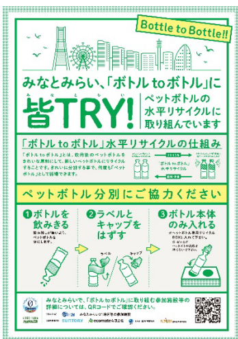
みなとみらい21地区で取り組む「ボトル to ボトル」広報ポスター

赤 食用油は家畜の飼料や色鉛筆の原料になり、国内消費でリサイクルはされていたのですが、国内消費量よりも海外に持っていくものが多い中、わざわざ船で海外に持っていくのではなく、SAFにして国内消費を増やす方が、無駄がないそうです。昨年10月から取組を始めて、3月までの5ヶ月間で約10トンを提供しました。国内では工場ができあがり、テスト稼働が始まったところで、今後SAFの材料になっていくと聞いています。今年度は、年度末までに15トンぐらいになると思います。また、昨年度、横浜市が実証実験をやっていた、空のペットボトルを回収して新たなペットボトルに再生していく「ボトル to ボトル」という取組にも参加をさせてもらい、1か月間で約128kgが集まりました。2025年から横浜市で新たに取組が始まるので、そこにも参加をしていきたいです。年間に7~8トンぐらいは回収できる見込みで、1番のポイントは、分別がされないと回収ができないので、考えながら取組みたいと思っています。