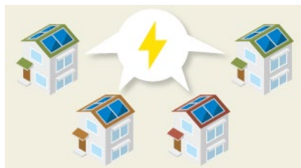
ご家庭の余剰電力を集めるイメージ

「自宅が発電所？」と思うかもしれませんが、SDGsに貢献する可能性は十分にあります。