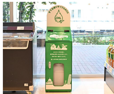
店頭に設置された廃食油回収BOX

の近くのスーパーでSAFの回収ボックスが置いてあるのですが、あまり目立たないし、気づいている感じがしません。それこそ高校に年に2、3回でも回収期間などがあるとみんな知る機会にもなるのではないかと思います。