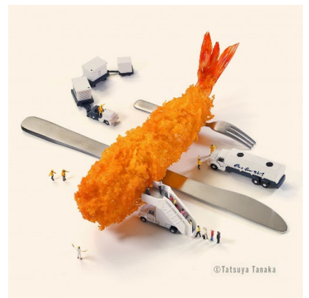
「Fry to Fly Project」のシンボル

赤 飲食店舗での使用後の油の新たな活用を昨年からは始めました。フライドポテトなどの揚げ物で油を使います。その食用油はある程度使うと捨てることになります。これをリサイクルしていたのですが、昨年からはそれをもう一つ進めようということで、使用後の油を S A F (サブ) に変えるという取組「Fry to Fly Project」に参加しています。