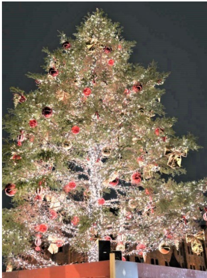
クリスマスマーケットのツリー

赤 東北に行くことが多いですね。ちなみに、毎年新たな木を使用しているわけではなく、イベント終了後に、横浜市内の山に移して保管をしています。保存状態が良ければ、次の年も使用しています。